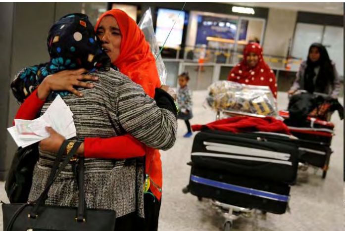
Washington at 3 p.m. PST (2300 GMT).

The 9th U.S. Circuit Court of Appeals in San Francisco will hear arguments over whether to restore the ban from Justice Department lawyers and opposing attorneys for the states of Minnesota and